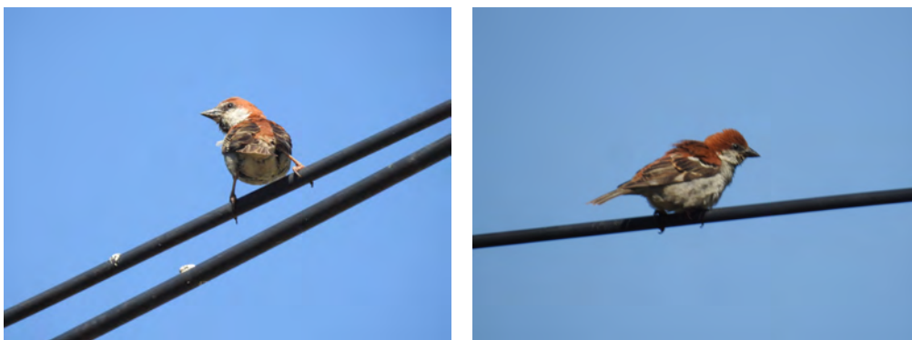
图1 山麻雀 Passer rutilans

山麻雀分布于我国河北、北京、天津、山东、河南、山西、陕西、宁夏、甘肃、青海东部、云南东北部、四川、重庆、贵州、西藏、湖北、湖南、安徽、江西、江苏、上海、浙江、福建、广东、香港、广西、台湾(郑光美,2011);国外主要分布于喜马拉雅山脉(约翰·马敬能等,2000)。